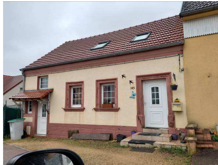
Maison 145, rue Nationale