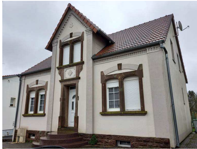
Maison 143, rue Nationale avec date portée 1924