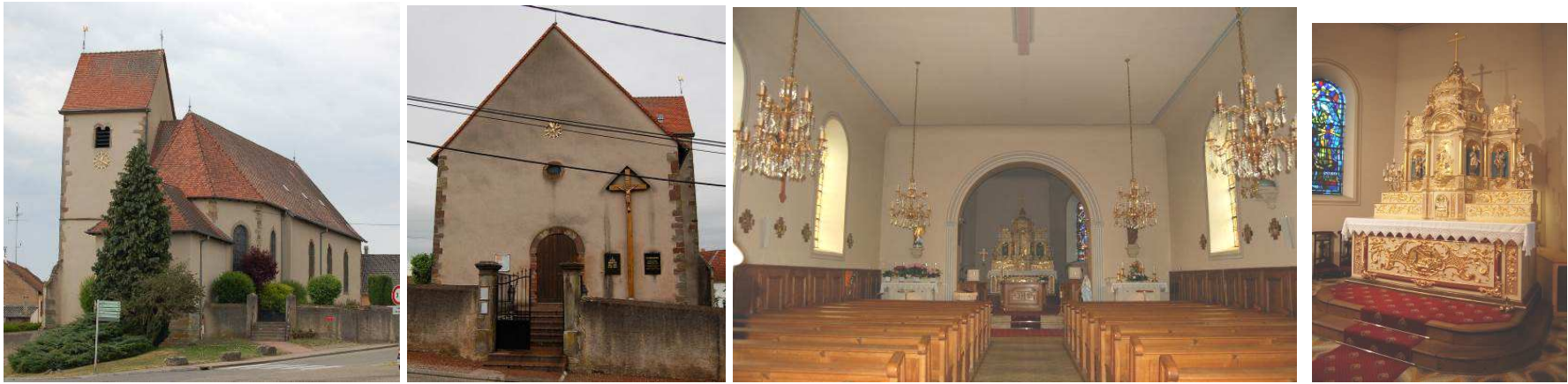
Eglise de l'annexe Roth recelant un maître-autel avec retable