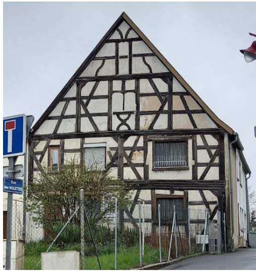
Maison à pans de bois entre la rue Nationale et la rue des Violettes