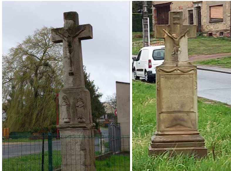
Croix de chemin, rue de la Fontaine (à g.) et rue Nationale (à d.)