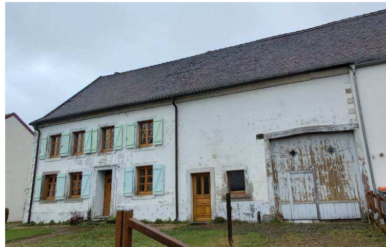
Ferme comprenant logis et grange, 115 rue Nationale